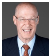
亨利·保尔森 美国前财政部长