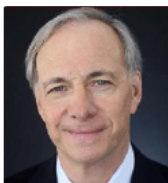
雷伊·达里奥 桥水基金创始人