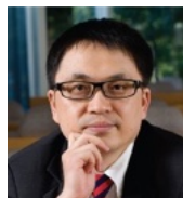
张磊 高瓴资本创始人、 董事长