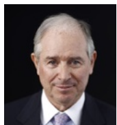
苏世民 黑石集团联合创始人