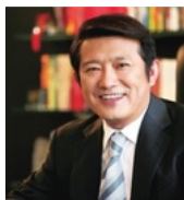
陈东升 泰康保险集团 创始人、董事长