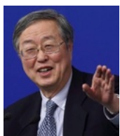
周小川 中国人民银行 前行长