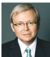
陆克文 澳大利亚前总理