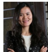
彭蕾 阿里巴巴联合创始人、 蚂蚁金服前董事长