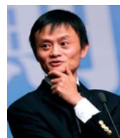
马云 阿里巴巴创始人、 董事局前主席