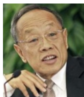
李肇星 中国前外交部长