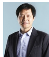
雷军 小米科技董事长兼 CEO